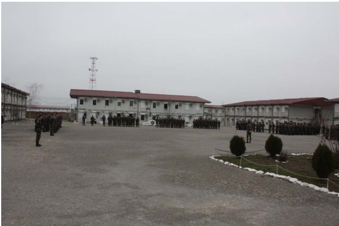
Overzicht over het gebeuren

Na de parade een receptie met speech en kadootjes. Weer moest ik iets in ontvangst nemen en weer de vele bedankingen. Inderdaad, ook van mijn kant want ik had in het begin geen goed oog in de Franse logistiek, maar ik heb mijn mening moeten herzien.