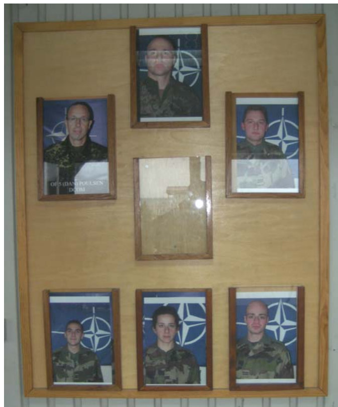
De nieuwe bevelhebbers?

Na een evaluatie van het materieel dat mee naar België moet en in het vooruitzicht van de verhuis voor 1 week, besluit ik op aanraden van Helga om een paar collis te maken. Door deze naar België te sturen kan ik mijn bagage beperken. Tevens kan ik zo enkele flessen die ik cadeau gekregen heb, verzenden zonder over de limiet te gaan.