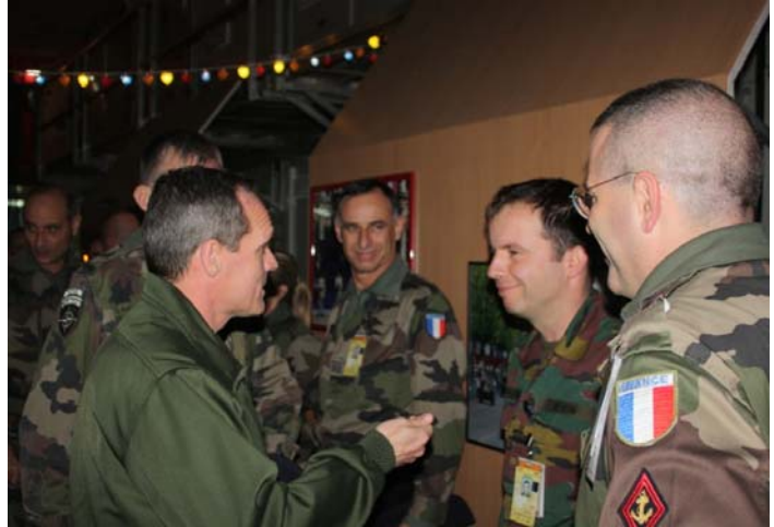
Luchtmachters onder elkaar, en de rest kijkt er naar.