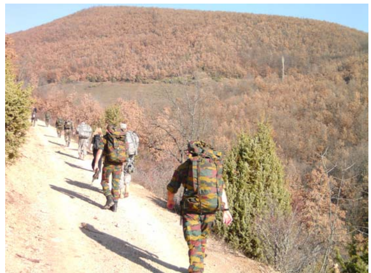
Al wandelend genieten van het landschap.