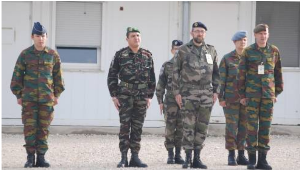
En langs achter. Je ziet direct dat de andere groepen groter zijn.