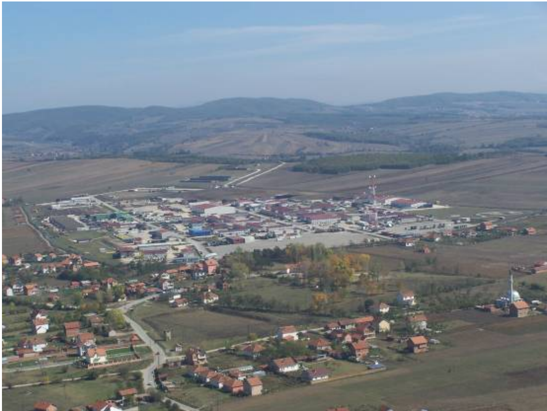
De forward assembly area nabij kamp Novo Selo (let op de tenten)