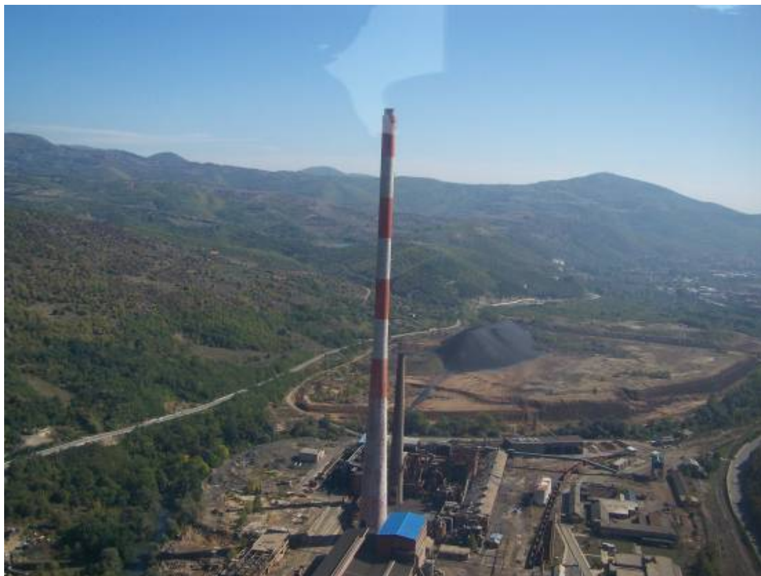
De zogenaamde BBQ