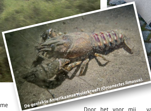
De gevlekte Amerikaanse rivierkreeft ( Orconectes limosus ).