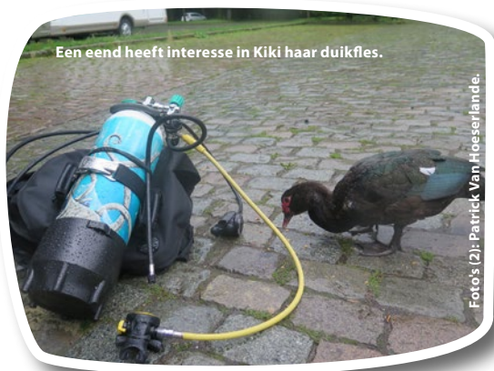
Een eend heeft interesse in Kiki haar duikfles.