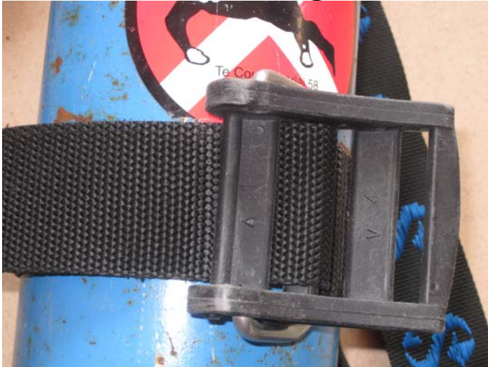
5. Riem door spleet 2