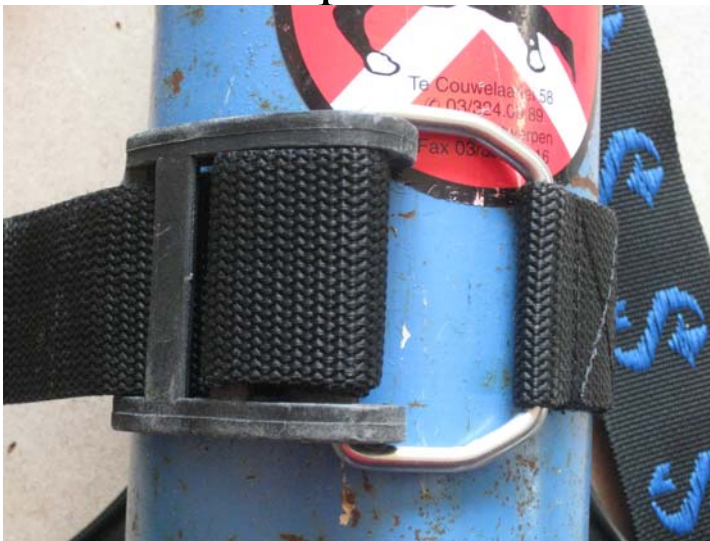
7. Gesp kantelen en aanspannen