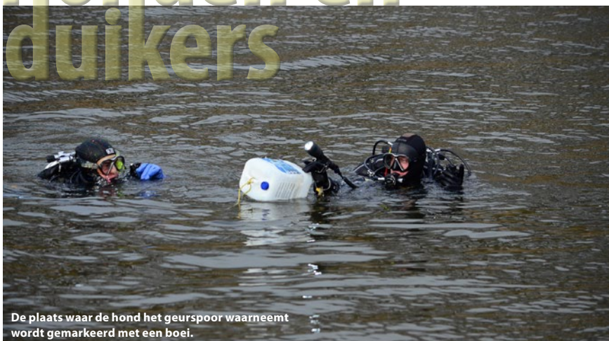
De plaats waar de hond het geurspoor waarneemt wordt gemarkeerd met een boei.