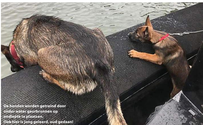
De honden worden getraind door onder water geurbronnen op ondiepte te plaatsen. Ook hier is jong geleerd, oud gedaan!