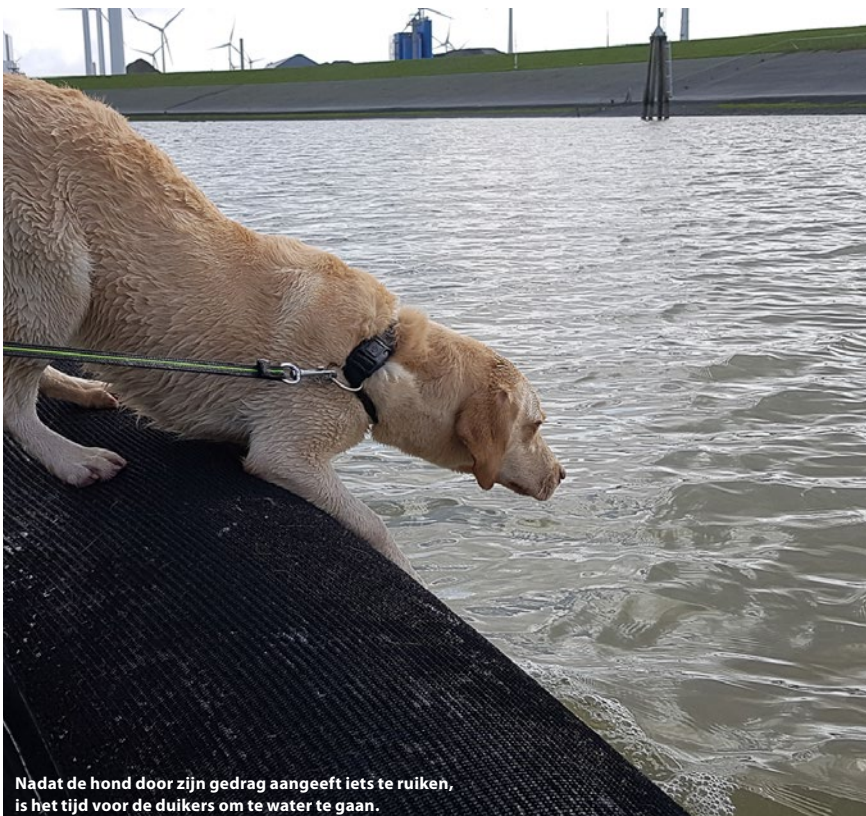
Nadat de hond door zijn gedrag aangeeft iets te ruiken, is het tijd voor de duikers om te water te gaan.

In de Hippocampus nr. 285 illustreert een foto met twee honden in een RIB het artikel met als titel 'NOB wil aanpassing ARBO-wet'. Toen ik de foto bekeek, vroeg ik me af wat de Nederlandse Onderwaterbond, en dus duikers, hiermee te maken hebben. Zoeken deze honden naar vermiste duikers aan of onder het wateroppervlak? Speuren ze naar dode duikers op de bodem? Duiken de honden naar verloren duikmateriaal (zou handig zijn) of vangen ze kreeften (zie https://imgur.com/xbLK9vf )? Omdat ik vermoed dat ook andere lezers van ons blad nieuwsgierig zijn, wilde ik deze vraag graag beantwoord zien.