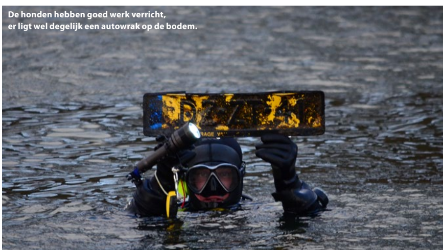
De honden hebben goed werk verricht, er ligt wel degelijk een autowrak op de bodem.

We weten allemaal dat honden over een superieure reukzin beschikken en dat, mits aangepaste training, we hen kunnen gebruiken om naar dingen (zoals truffels, drugs, voedingswaren, ...), dieren (zoals bijv. wolven) en mensen, levend en/of dood, te zoeken. Er bestaan hiervoor verschillende technieken zoals spoorzoeken en 'air scenting' die elk hun voor- en nadelen hebben. Honden die aan 'air scenting' doen, gebruiken de aanwezigheid van iedere menselijke geur op het terrein.