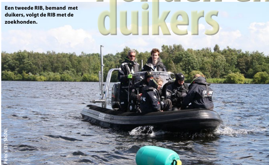
Een tweede RIB, bemand met duikers, volgt de RIB met de zoekhonden.