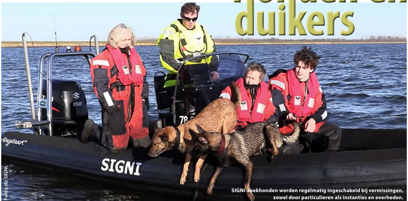
SIGNI-zoekhonden worden regelmatig ingeschakeld bij vermissingen, zowel door particulieren als instanties en overheden.

In de Hippocampus nr. 285 illustreert een foto met twee honden in een RIB het artikel met als titel 'NOB wil aanpassing ARBO-wet'. Toen ik de foto bekeek, vroeg ik me af wat de Nederlandse Onderwaterbond, en dus duikers, hiermee te maken hebben. Zoeken deze honden naar vermiste duikers aan of onder het wateroppervlak? Speuren ze naar dode duikers op de bodem? Duiken de honden naar verloren duikmateriaal (zou handig zijn) of vangen ze kreeften (zie https://imgur.com/xbLK9vf )? Omdat ik vermoed dat ook andere lezers van ons blad nieuwsgierig zijn, wilde ik deze vraag graag beantwoord zien.