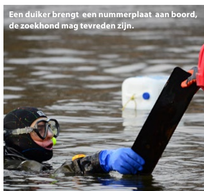
Een duiker brengt een nummerplaat aan boord, de zoekhond mag tevreden zijn.

een zeer lange tijd geur (gas) af dat naar de oppervlakte stijgt (nee, niet in de vorm van bellen). De honden zijn getraind op die specifieke geur en duiden de plaats met de sterkste waarneming aan. Hierdoor wordt eerst en vooral de aanwezigheid van een slachtoffer bevestigd en daarnaast ook het gebied dat met andere middelen doorzocht moet worden sterk ingeperkt. De honden zorgen er dus voor dat een uitgebreid zoekgebied op een snelle manier gereduceerd wordt tot een kleiner werkgebied dat beter geschikt is om met precisiemateriaal te onderzoeken.