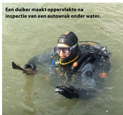
Een duiker maakt oppervlakte na inspectie van een autowrak onder water.

De honden van SIGNI worden meestal ingeschakeld wanneer in een bepaald gebied een persoon (mogelijk) verdrongen is. Hierbij is tevens de exacte locatie van het stoffelijk overschot of de plaats van verdrinking onzeker. Het af te speuren wateroppervlak is door die opeenstapeling van onzekerheden te groot om met duikers de bodem af te zoeken. De honden kunnen een groot gebied snel controleren door vanaf een boot of de waterkant te zoeken naar menselijke geuren. Een stoffelijk overschot geeft immers