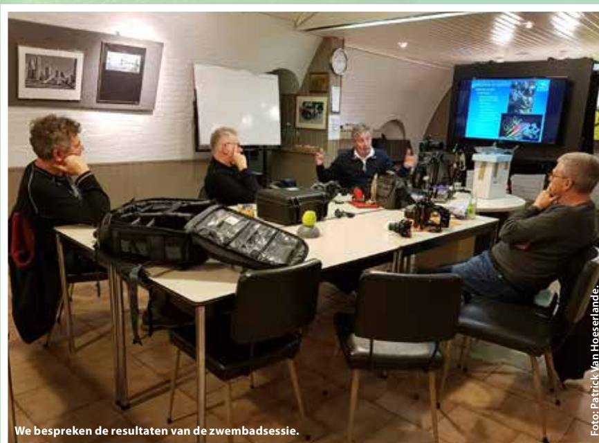
We bespreken de resultaten van de zwembadsessie.

Na een nat volgt er een droog gedeelte: huiswerk. Aan de hand van de foto's moeten we voor iedere afstand de goede diafragma-instelling bepalen. We proberen daarmee het richtgetal van de flitser