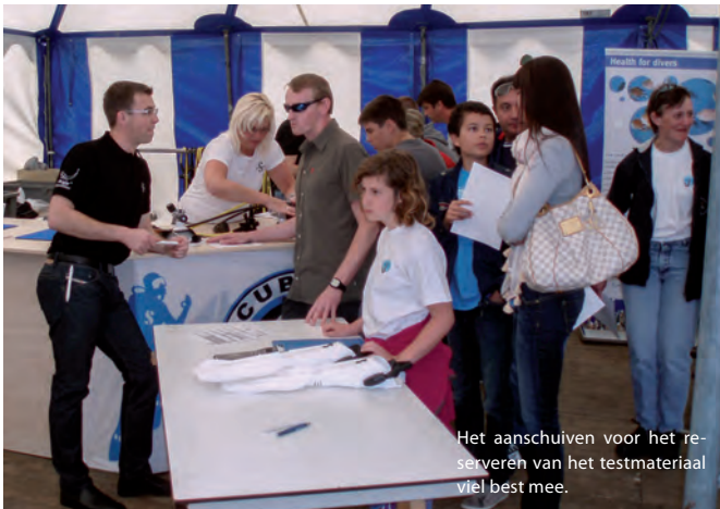
Het aanschuiven voor het reserveren van het testmateriaal viel best mee.