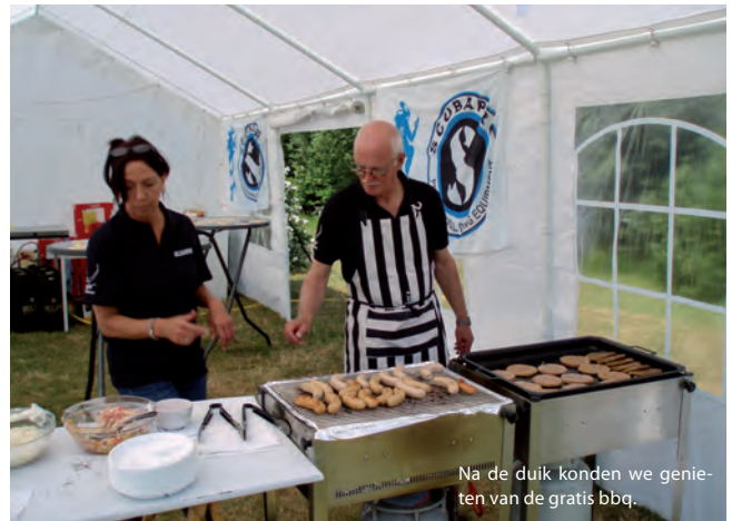
Na de duik konden we genieten van de gratis bbq.