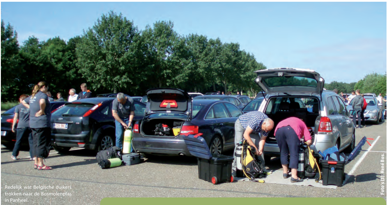
Redelijk wat Belgische duikers trokken naar de Bosmolenplas in Panheel.