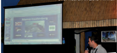
Morne Hardenberg toonde zijn film en foto's over haaien in Zuid-Afrika.