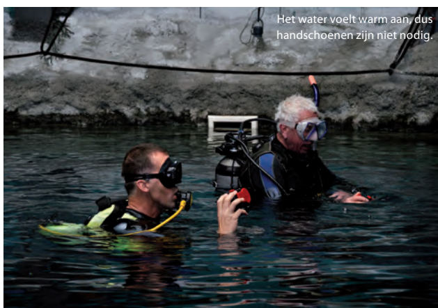
Het water voelt warm aan, dus handschoenen zijn niet nodig.