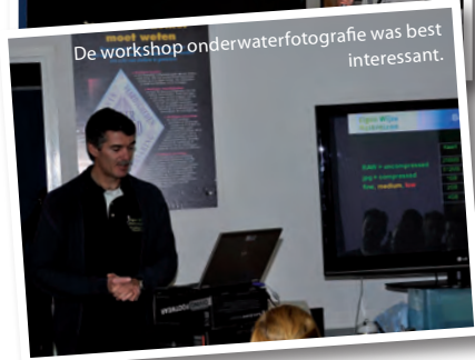
De workshop onderwaterfotografie was best interessant.