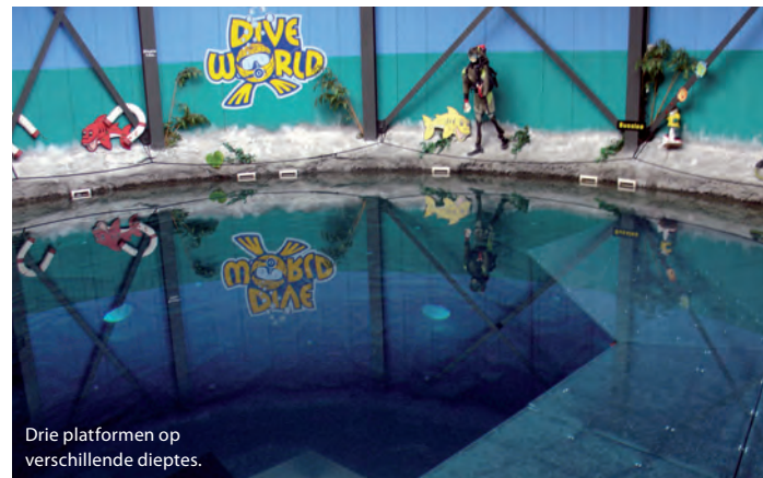
Drie platformen op verschillende dieptes.