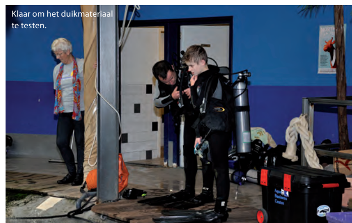
Klaar om het duikmateriaal te testen.