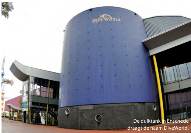
De duiktank in Enschede draagt de naam DiveWorld.