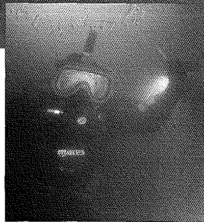
Wie denkt goede zichtbaarheid te vinden, vergist zich.

Maar wat ik nog het meest van die cursus opgestoken heb, is de zorg voor het materieel. Wij, sportduikers zijn al tevreden dat een duikpak een 200-tal duiken mee gaat. Als een beroepsduiker daar