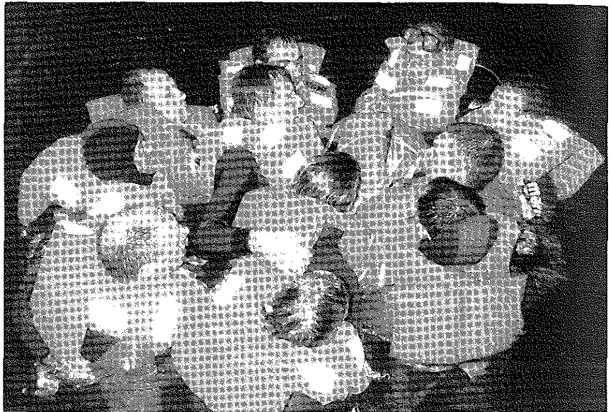
Om te overleven in zee blijf je best in groep.

Na deze videofilm van een uur, werden we in ploegen ingedeeld en werd de rest van de dag uit de doeken gedaan. De bedoeling was onder begeleiding van een instructeur een circuit van zeven stops te doorlopen, met op iedere stop een 20-tal minuten om te oefenen. Na een pauze van een kwartier zullen we het circuit moeten doorlopen, maar dan met alle effecten. Maar eerst de oefenin-