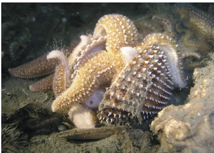
In het aquarium enkel dieren uit de Oosterschelde en de Noordzee.

Begin 2007 arriveert per schip, vanuit Amerika, de glazen voorwand van 13 x 3 meter en 15 centimeter dik. Als alles waterdicht is wordt het aquarium gevuld met 300.000 liter zeewater. Voor de glazen wand komt een tribune waar de bezoekers zes keer per dag een interactieve voedershow zullen kunnen zien. Het is de bedoeling dat duikers met camera's beelden maken en inzoomen op details die op een groot scherm worden geprojecteerd zodat de bezoekers een optimaal beeld krijgen van het voeren. Medewerkers van Aquapolis verstrekken daarbij de nodige uitleg.