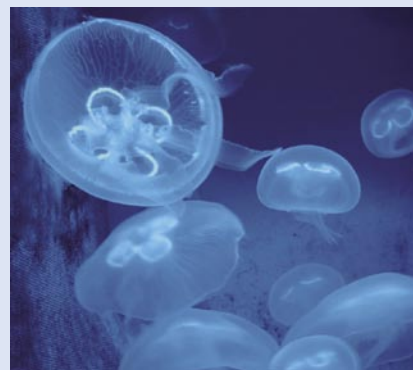
Oorkwallen - zoals deze in een aquarium - slapen niet, maar sommige kwallen blijken dat wel te doen.