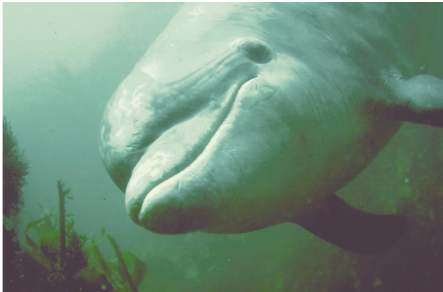
De bescherming van dolfijnen is dringend en noodzakelijk.