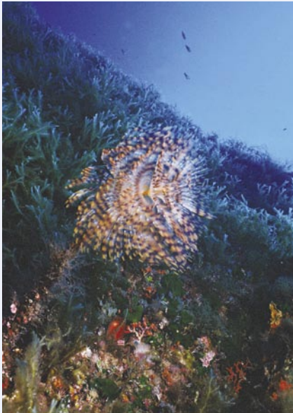
Prachtige kokerwormen sieren de zeebodem.

leren is hun versie van ‘gezondheid’: saha. Zeker weet ik het natuurlijk niet, want zelfs hun letters zijn anders. Het Maltees is een door de Europese Unie als taal aanvaard dialect van het Libanees, verrijkt met woorden uit het Portugees, Frans, ... De Britse overheersing heeft dit Latijns geschreven Arabisch niet van de troon kunnen stoten en slechts kunnen bewerkstellingen dat het Engels een tweede taal is.