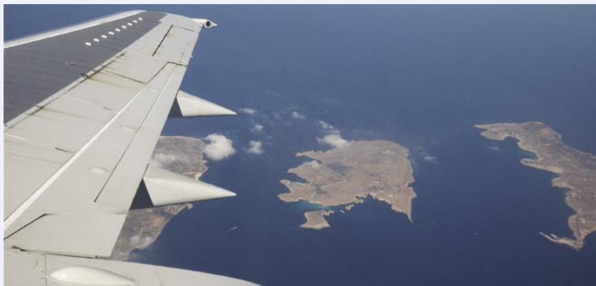
V.l.n.r.: Gozo, Comino en Malta.