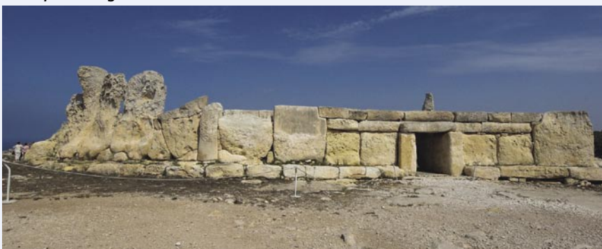
De tempel van Hagar Qim.

aarde, gesymboliseerd door een volslanke dame. Ter ere van haar werd jaarlijks het mooiste meisje uit het dorp geofferd. Als je in de straten loopt, krijg je de indruk dat de lokale schoonheden nog altijd schrik hebben van dit ritueel.