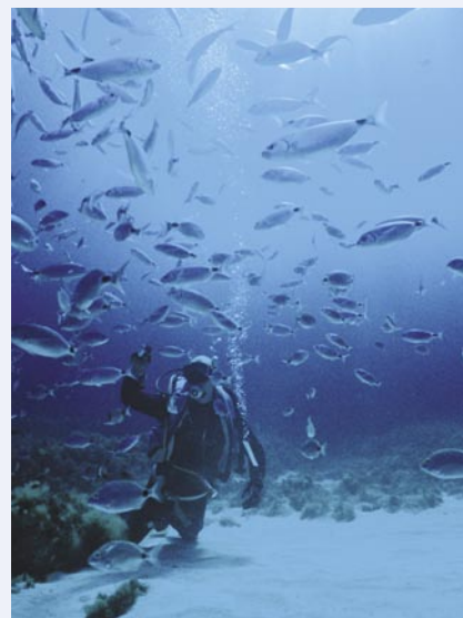
Een duik op Comino Caves.

Volgens mij hebben ze naast het kruis ook hun liefde voor vuurwerk aan de Duitse belegering te danken. Bijna ieder avond hoor je wel ergens vuurwerk. Zelfs overdag durven ze het, hoewel ik daar de bedoeling niet van in zie. Een overblijfsel van de spectaculaire luchtaanvallen tegen de nachtelijke hemel? Zeker op Gozo waar ze ieder weekend