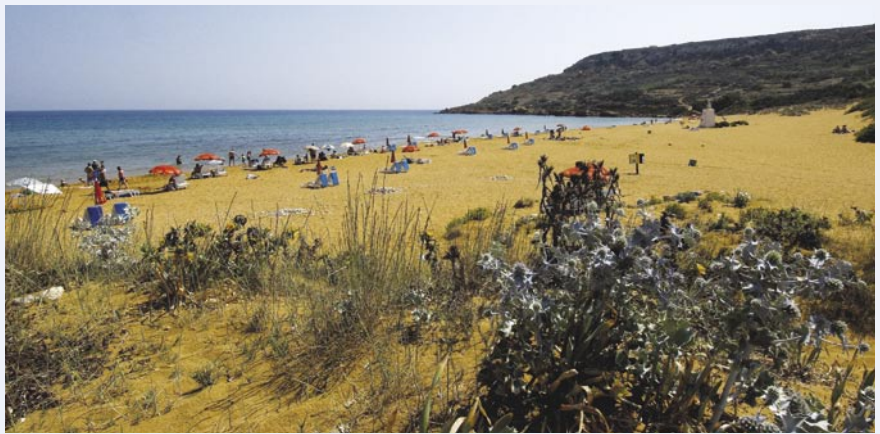
Ramla Bay op het eiland Gozo.

Oef, eindelijk! Rustig zet ik me neer en voel het zoute water langs de weinige open ruimtes tussen lichaam en pak omhoog kruipen. Verkoeling! Het uitzicht is prachtig: voor mij vormt een groot vierkant gat in de rotswand in combinatie met een blauwe hemel het 'Azure Window'. Een meter van mij bevindt zich een gat waardoor het gefilterde licht voor een uniek, blauw schouwspel zorgt. Als iedereen voldoende afgekoeld is, zwemmen we naar het gat. Laatste OK-teken, lucht aflaten en rustig afdalen. Door een tunnel richting open zee komt er een beetje licht binnen waardoor het gat een sprookjesachtige allure krijgt. Met een beetje fantasie zie je in de aangrenzende grot een oude zeeoversschat liggen. De werkelijkheid is echter beter: het begin van een reis onder water. Enkele vissen hebben hun toevlucht gezocht in de bescherming van het gewelf. Hier en daar staan waaierkokerwormen met de lichte deining mee te dansen. Hoewel er nooit een gevaar is, geeft de overdekte omgeving een claustrofobische sensatie die de zintuigen extra aanscherpt. Na een kort verblijf draaien we richting zee.