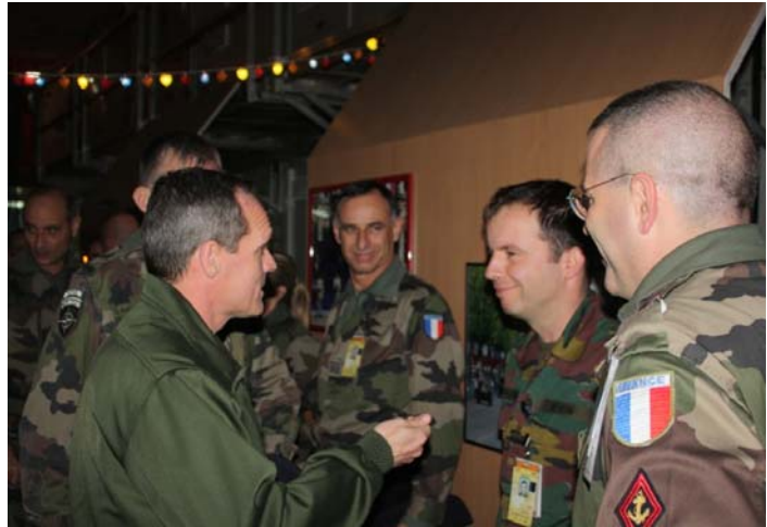
Luchtmachters onder elkaar, en de rest kijkt er naar.