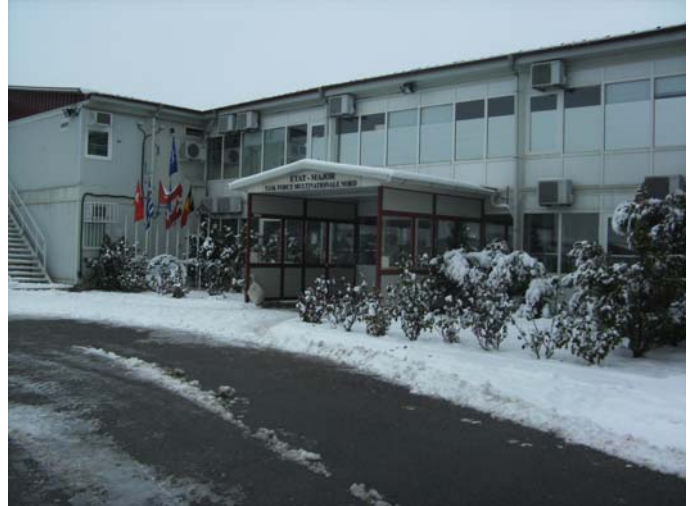
Sneeuw en het hoofdkwartier.