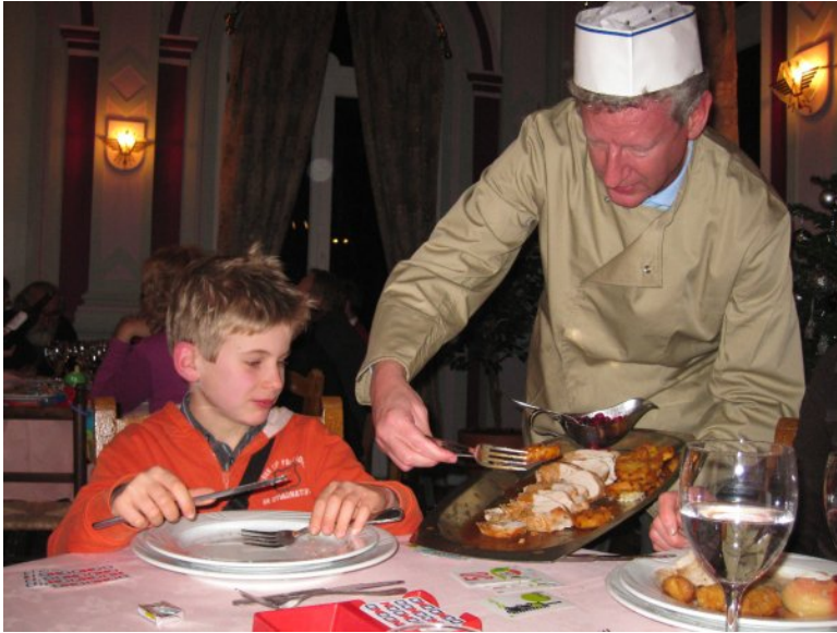
Leuk zo bediend worden.