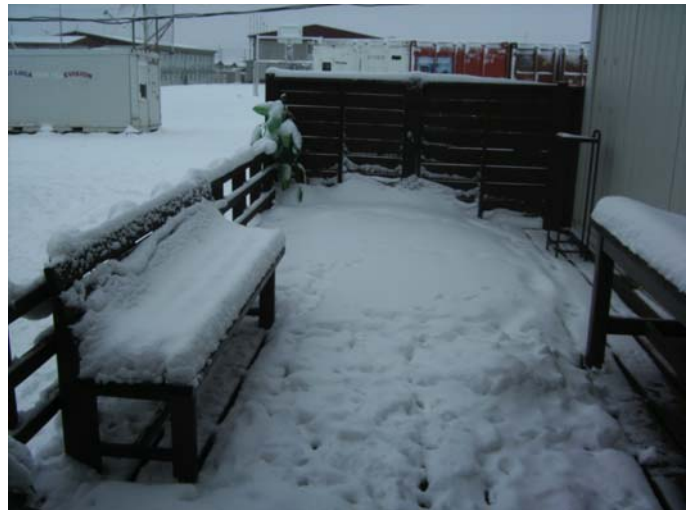
Het terras. Eens meten hoe veel sneeuw er gevallen is.