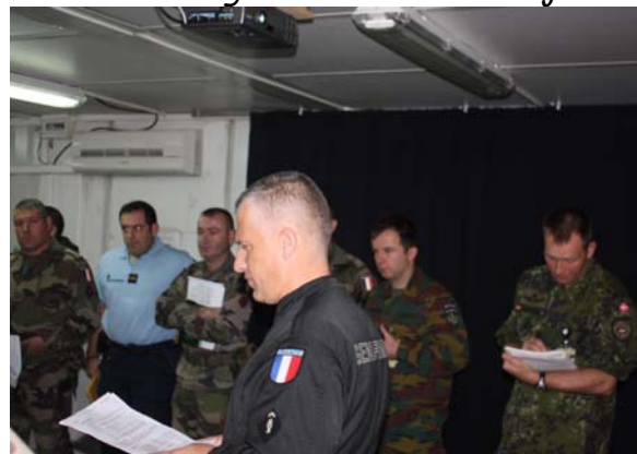
Een oefening op kaart.