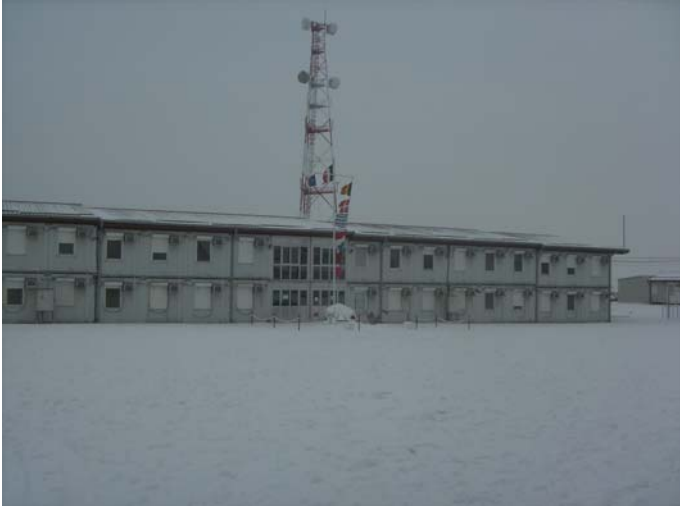
Een ondergesneeuwd paradeplein.