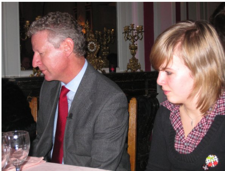
Amber tafelt gezellig met Minister De Crem.