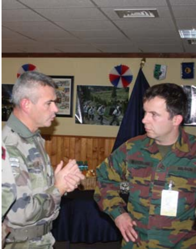
Discussie met de toekomstige commandant van de Battle Group.