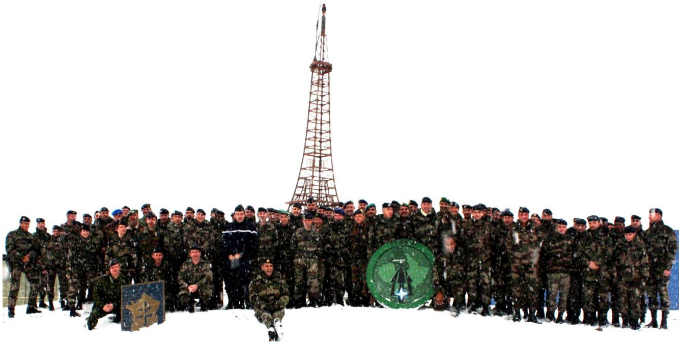
De groepsfoto van het hoofdkwartier MNTF - het wintermandaat.

De COS wil kost wat kost een foto van de staf in de sneeuw. Hij typeert de ploeg immers als het wintermandaat en daar hoort sneeuw bij. Vanmiddag is het moment. Het resultaat is best leuk.