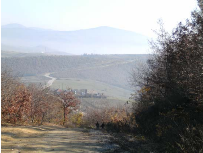
Wat een zicht!