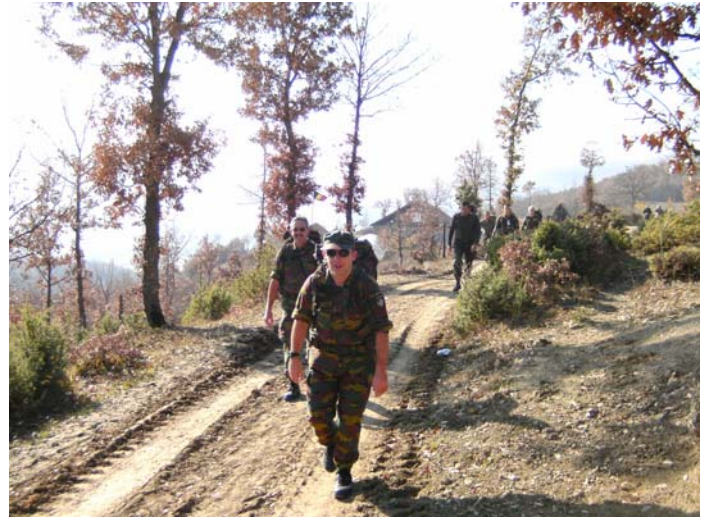
Lachend de berg op.