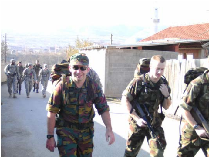
Een luchtmachter met rugzak aan het marcheren?

De vergadering betrof een dringende beveiliging van een transformator die de sleutel tot het noorden is. Blijkbaar kan de lokale Electrabel het noorden, de Serviërs, niet tot betalen dwingen door de elektriciteit af te sluiten zonder deze transformator stil te leggen. Pech wil dat deze transformator in het Servisch gedeelte ligt en deze dus niet zullen plat leggen. De commandant van KFOR wil dat we de toegang ertoe surveilleren.