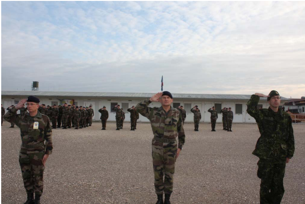
Vlaggengroet (let op de Deense en Franse groet)

goed. Boven stonden de dokter en mijn medische specialist. Het is toch niet waar zekers!