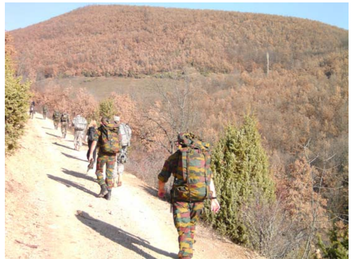
Al wandelend genieten van het landschap.