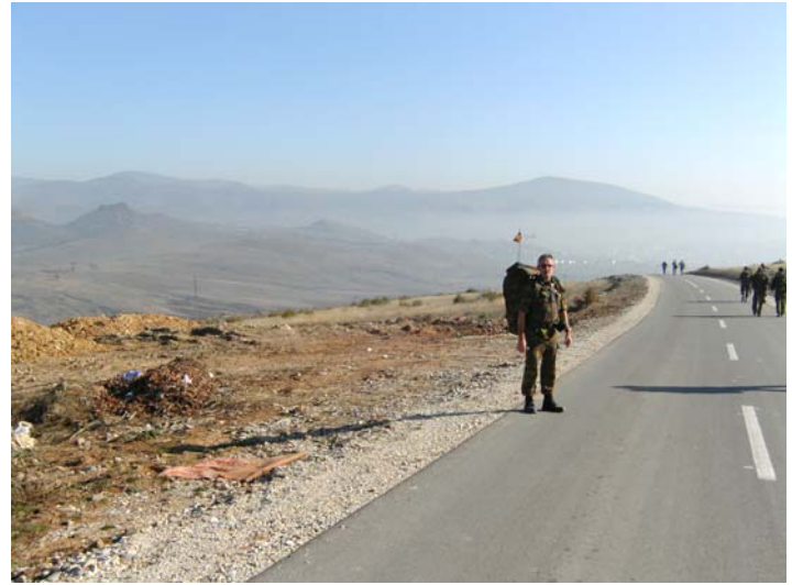
Als je de fot vergroot zie je drie 'symbolen' van Mitrovica: het oud fort, de BBQ en Kroi-i-Vitakut.

Eerst was er sprake om dit met vaste observatieposten, in feite kleine kampjes te doen. Maar toen ik de COS vertelde wat dat allemaal inhield in een wintertijd en dat dit niet echt strookte met het verminderen van vaste kampen, werd voor een andere oplossing gekozen. Ik moest er dus niet echt meer zijn. Toch een paar belangrijke lessen uit de analyse getrokken die ik nog verder wil uitspitten.