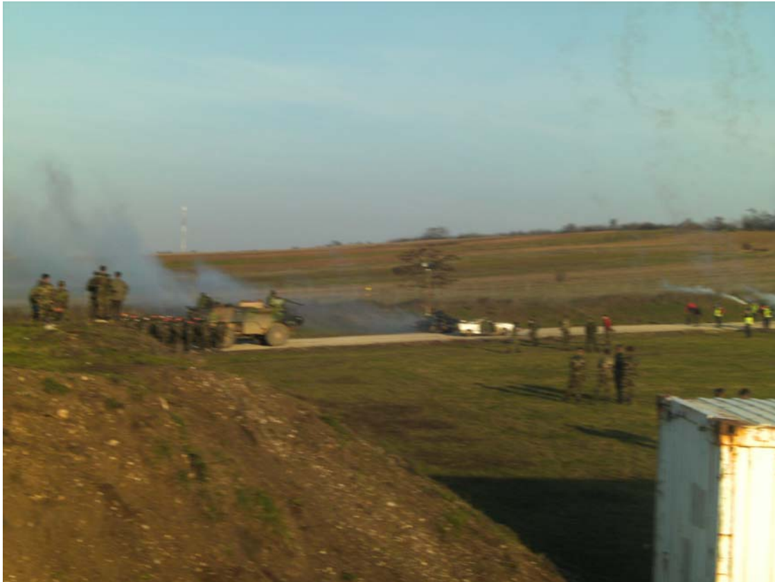
Pantserwagen in actie tegen een blokkade

Met tranende ogen richting Pristina getrokken. Doel was duidelijkheid over de ID Cards te krijgen. De SOP is iets te ingewikkeld om een rechte lijn te trekken. Trouwens de rechte lijn zou de Fransen niet bevallen, zodat ik zeker van mijn stuk moest zijn. De Amerikaan begon met te zeggen dat het duidelijk was, totdat ik hem