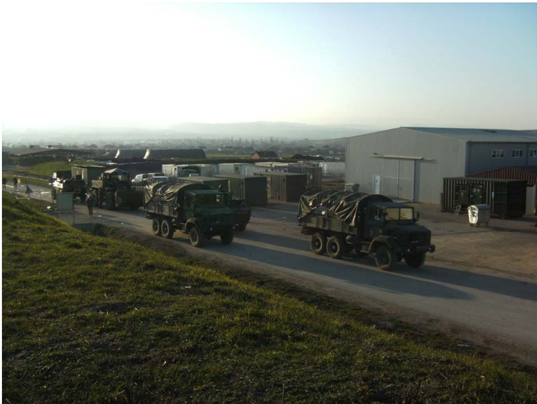
Het vervoer, de pantserwagen, de bulldozer en de ambulance