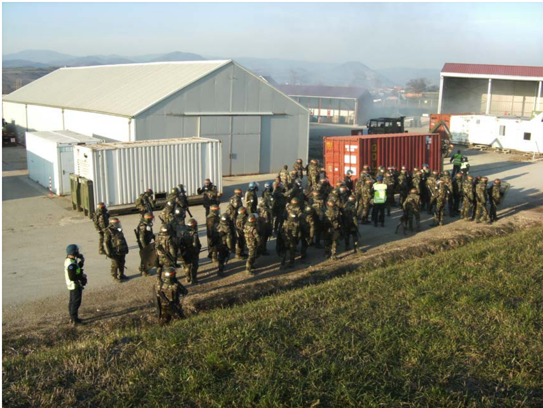
Vorbereiding op de 'charge'