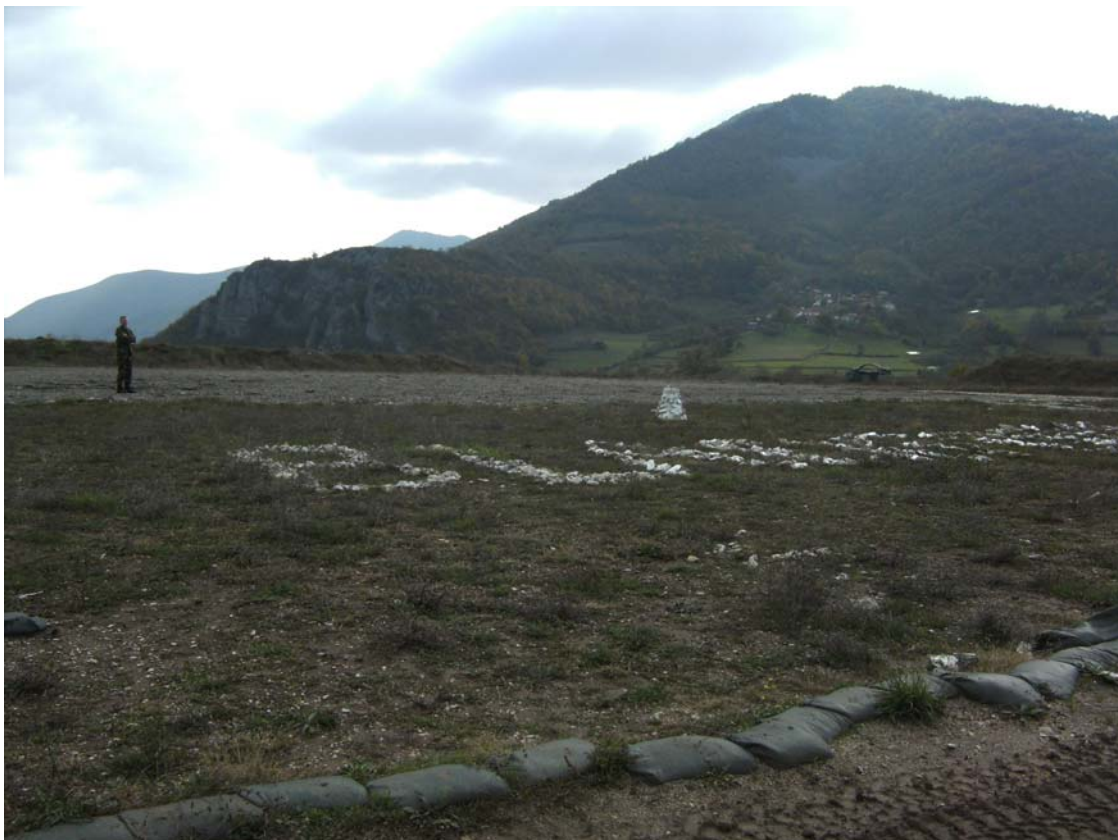
Het verlaten kamp. Binnenkort een archeologische site?

Wij, dat is Helga, Albert, een Franse collega en mezelf, naar Gate 1. Eigenlijk wou Helga haar tolk van vroeger bezoeken. Wij zouden er van profiteren om het oud, verlaten KFOR kamp te bezoeken. Daar moet er voor een oefening Gate 1 gesimuleerd worden met behulp van een aantal containers. Bij mijn vorig bezoek had ik geen kamp gezien, dus groot kon dat niet zijn. Het probleem is niet de grootte, maar de weg er naar toe. Immers, de containers moeten met een vrachtwagen gebracht worden en kan dit bij regenweer? Hieronder een foto van het kamp en één van de omgeving.