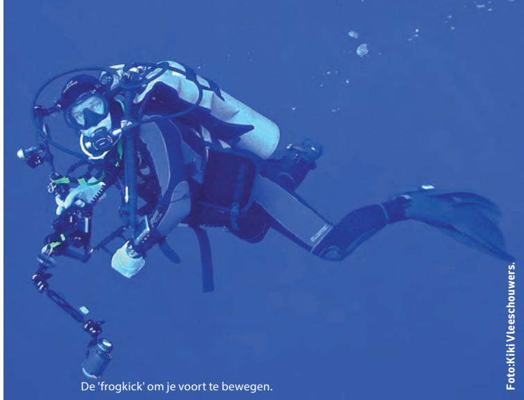
De 'frogkick' om je voort te bewegen.