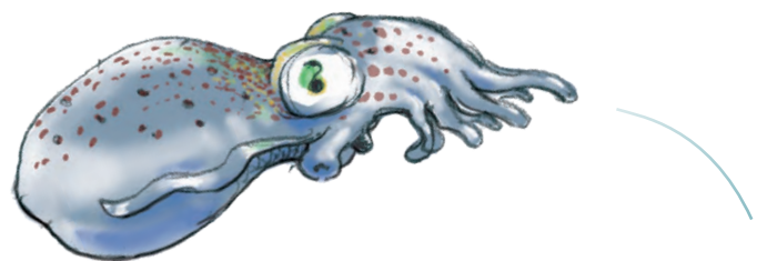
Cartoons: Peter Bosteels.

Weetje: Haal nu even je vergrootglas boven! Probeer rustig de worm te benaderen, zodat hij zijn veren, euh, tentakels dus, niet intrekt. Vaak zie je op die tentakels heel kleine witte wezentjes rondkruipen. Bolletjes met 2 uitsteeksels. Dit zijn roeipootkreeftjes die het heel prettig vinden samen te leven met de worm.