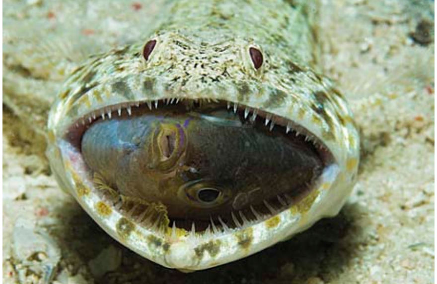
Een hagedisvis die juist een geelrug juffertje heeft opgeslokt. Niet echt buddy's, maar ze zullen wel een tijdje samen rondzwemmen. Smakelijk!