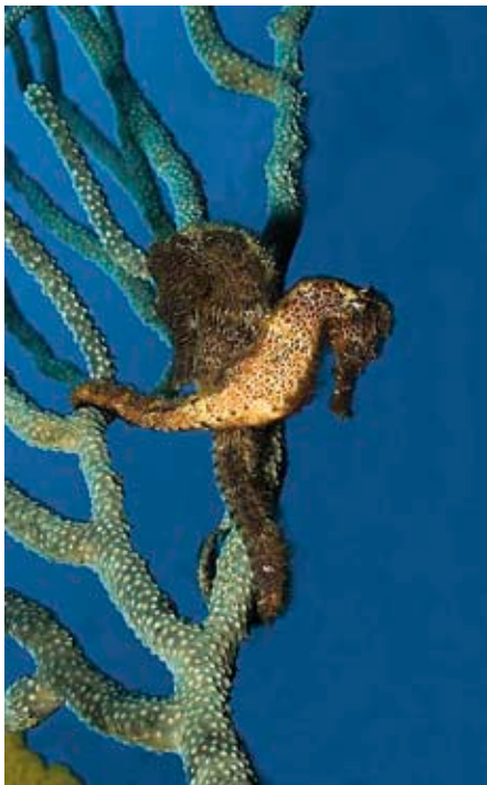
Knuffelen zeepaardjes ook?

Sinds mijn thesis over soloduiden word ik soms door collega-duikers aan de waterkant over dit gevoelig onderwerp aangesproken. Daarbij zijn er steevast een aantal verwonderd als ze mijn buddy zien. Niet dat mijn buddy zo speciaal is, nee, het feit dat hij of zij er überhaupt is.