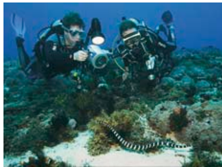
Toch wel een unieke belevenis als je samen een zeeslang ontmoet.