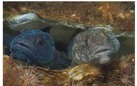
Een koppeltje zwarte grondels bewaken hun eieren. Romantisch, hé?