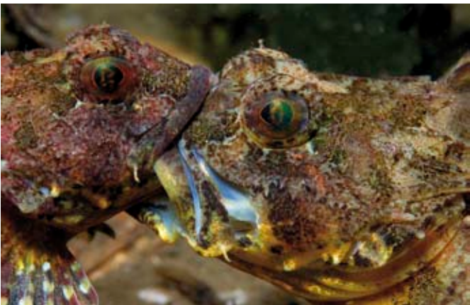
Twee groene zeedonderpadden geven elkaar een kus. Of zijn ze aan het vechten? In ieder geval iets om straks na de duik over te praten met je buddy.