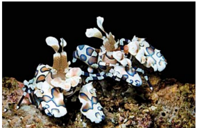
Een koppeltje harlekijngarnalen.