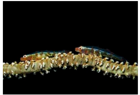
Twee grondeltjes op een zweepkoraal.