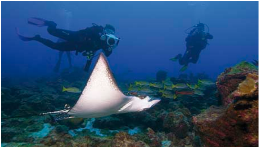
En wij hebben een adelaarsrog gezien!