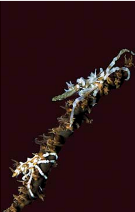
Twee dwerggarnalen op een zweepkoraal.