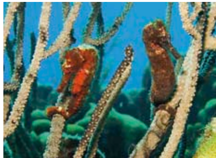
Een koppeltje zeepaardjes... als enkel jij ze gezien hebt, gelooft men je zelden.