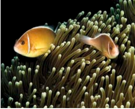
Om minutenlang van te genieten: speelse anemoonvisjes die verstoppertje spelen in hun woning, de zeeanemoon.