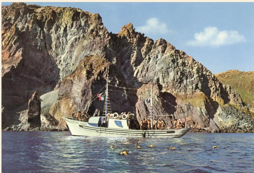
Duiken vanaf een boot langs rotsachtige kusten.

Op de bodem kon je door bruinwieren overwoekerde munitiehopen vinden en in de modder allerlei onderdelen van de oorspronkelijke lading, waaronder Smith and Wesson revolvers. We hebben twee dagen in de modder gewroet en een massa onderdelen van revolvers gevonden tot enige complete revolvers toe. Alles was overdekt met een dikke korst van kalkachtige substraten en behuizingen van zeedieren. Pas als je de korst kapot sloeg, zag je wat er in verborgen zat. Tot onze verbazing werkten 30 jaar na de oorlog zelfs de veertjes nog in de revolvers,