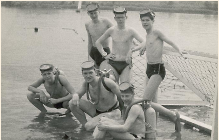
Duiken gebeurde in het begin in zwembroek, duikpakken waren er niet.

Grote modderwolken ontnamen mij het zicht op het toch al niet zo bijzonder interessante onderwaterlandschap, maar de kick om voor het eerst onder water te ademen, vergoedde veel. Het was zaak niet teveel naar voren te