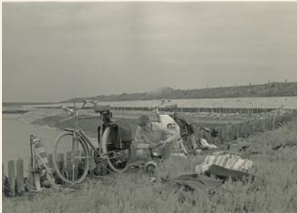
Met de fiets naar de duikplaats.

stond, was miniem. De weinigen die onder water wilden, moesten zich met oude Duitse gasmaskers behelpen, waarbij de slurf door een stuk kurk of hout omhoog werd gehouden. In de U.S.A. en Frankrijk was de onderwatersport al iets meer geëvolueerd, maar de ontwikkelde duikuitrustingen bleven door taal, douane en financiële barrières buiten ons bereik.