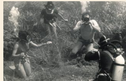
Oefeningen uitvoeren onder water.

Om de financiën enigszins te sparen was op voorhand besloten dat we zoveel mogelijk van de zee zouden leven. Mosselen werden er geplukt en er werd gevestigd. Zonder medewerking van de visstand lukt vissen echter